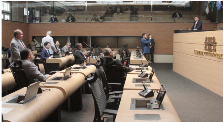
Vereadores abordam caso em que integrantes da Prefeitura foram monitorados por agentes da Polícia Civil