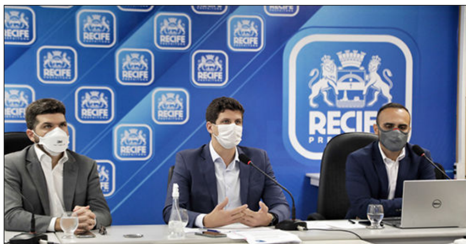
No ato de lançamento do Recife Parceria, prefeito assinou Projeto de Lei com a atualização das regras de PPPs e concessões

Participaram do encontro representantes da Federação das Indústrias do Estado de Pernambuco (Fiepe), Associação das Empresas do Mercado Imobiliário de Pernambuco (Ademi-PE), Sindicato da Indústria da Construção Civil no Estado de Pernambuco (Sinduscon-PE), Movimento Pró-Pernambuco (MPP), Softex Recife, Porto Digital, Young Presidents' Organization (YPO), Grupo de Líderes Empresariais de Pernambuco (LIDE-PE), Câmara de Dirigentes Lojistas do