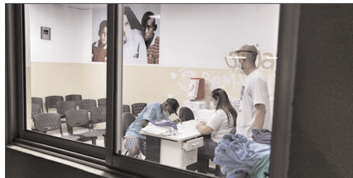
Primeiras ações previstas a partir da publicação da Política serão a vacinação da população em situação de rua contra covid-19 e influenza

A Política vai descrever como o município planeja, executa e monitora as ações em saúde para a população em situação de rua, uma vez que ela possui níveis de vulnerabilidade e complexidade bastante elevados. A partir de sua implantação, os oito Distritos Sanitários da cidade passarão a trabalhar com uma linha de cuidado e estratégias pensadas especificamente para assegurar