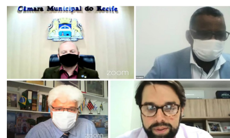
Comissão de Mobilidade discutiu as ações promovidas

TI Joana Bezerra - Sobre a visita da Comissão ao terminal Joana Bezerra, junto à equipe do Grande Recife Consórcio de Transporte, na última quarta-feira (28), o presidente do colegiado disse que ficou satisfeito com as medidas adotadas pelo órgão na prevenção ao coronavírus. “O esforço está sendo gigante para que os ônibus deixem o terminal com todas as cadeiras ocupadas e com 20% de passageiros em pé. Vi a disponibilidade de máscaras com os organizadores da fila e do álcool em gel”.